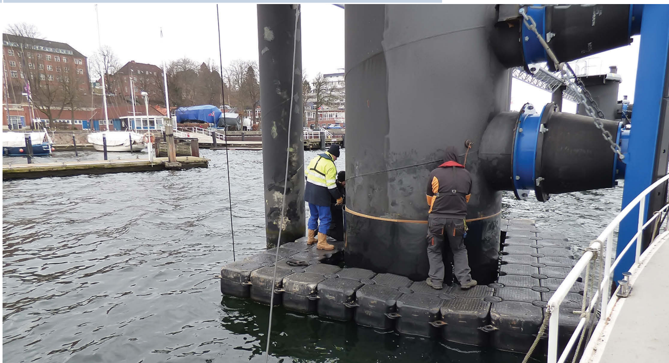
ПРИМЕНЕНИЕ СИСТЕМЫ MARINE PROTECT™ В БАЛТИЙСКОМ ПОРТУ КИЛЬ, ГЕРМАНИЯ

антикоррозионной защиты ГТС, которые основаны на применении самых разных материалов и способах их нанесения, в том числе на таком, как окраска антикоррозионным составом. Насколько Ваша многокомпонентная технология конкурентоспособна по стоимости другим технологиям?