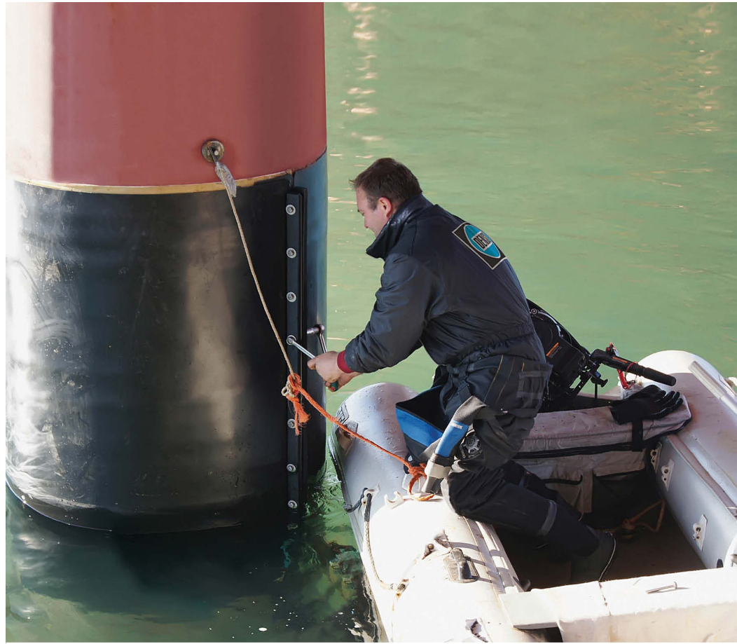
ПРИМЕНЕНИЕ СИСТЕМЫ MARINE PROTECT™ В ЧЕРНОМОРСКОМ ПОРТУ ТАМАНЬ

Лента Marine Protect™-Tape, являющаяся основным антикоррозионным слоем системы, состоит из прочного нетканого полотна на основе полипропилена, пропитанного стабилизированной полимерами петролатумной массой. Лента отличается высокой пластичностью и моделируемостью и