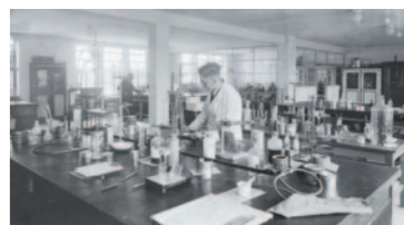
Pionierarbeit bei der Entwicklung der DENSO®-Binde

Seit 100 Jahren steht der Name DENSO (lat. dicht machen) für Innovationen. Bereits 1927 entwickelte das junge Unternehmen eine spezielle Petrolatum-Binde zum Schutz von Rohrleitungen. Schnell wurde die DENSO®-Binde das Synonym für den passiven Korrosionsschutz von Pipelines. Und DENSO gilt seither als das Markenzeichen für zukunftsweisende Abdichtungslösungen.