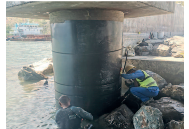
Восточный Тимор, контейнерный порт Тибар MarineProtect®-100 30 свай, DN 1800 (72")