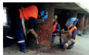
Forte corrosion sur les piliers

L'eau de mer est l'un des milieux naturels les plus agressifs. C'est particulièrement vrai dans les zones directement exposées aux projections d'eau contaminée par des acides, mais aussi dans les zones marnage, où les piliers ou les conduites sont exposés à l'air, au rayonnement UV et au sel. Les contraintes mécaniques telles que la houle, les débris flottants, la formation de glace et l'envahissement par la végétation marine accélèrent le processus de détérioration. Défier ces conditions extrêmes à long terme n'est possible qu'avec la protection DENSO adaptée : MarineProtect®.