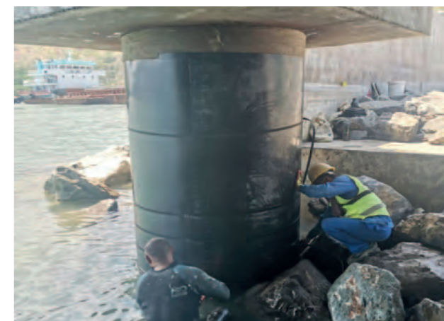
Timor oriental, port de conteneurs de Tibar MarineProtect®-100 30 piliers, DN 1800 (72")