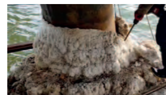
Dépôts de sel agressifs