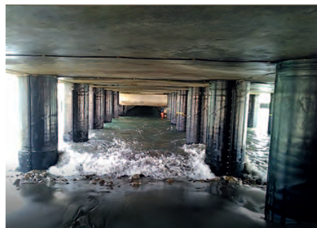
Pérou, port de Talara MarineProtect®-2000 FD 206 piliers, DN 1000 (40")

De Bora-Bora au Turkménistan : MarineProtect® a déjà fait ses preuves dans les Caraïbes, l'Atlantique, la mer Caspienne et la mer Noire depuis des années.