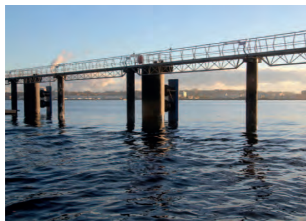
Allemagne, port de Kiel, quai vers la mer Baltique MarineProtect®-2000 FD protection des piliers sur le plus grand quai pour l'accostage des paquebots de croisière, DN 2400 (96")