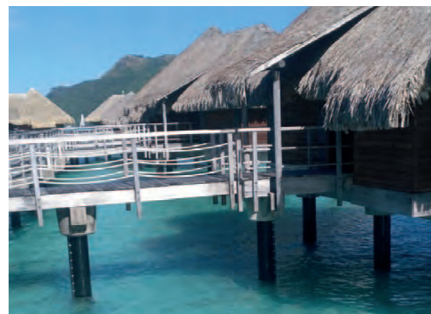
Polynésie française MarineProtect®-2000 FD 1.019 piliers, DN 300 (12")