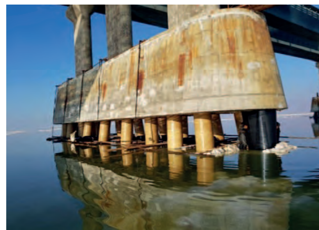
Iran, pont dans le lac d'Ourmia MarineProtect®-100 372 piliers, DN 800 (32")