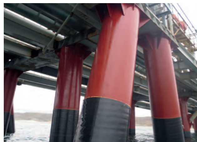
Russie, mer Noire, port maritime de Taman MarineProtect®-2000 FD 500 piliers, DN 1220 (48")