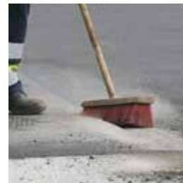
Flanke reinigen und trocknen

Auch beim TOK ® -Band A ist kein zeitintensiver Anstrich mit einem Primer notwendig. Marc Neumann, Bauleiter der A-Tec Asphaltbau GmbH, erklärt: „Wir müssen das TOK ® -Band A nur ganz leicht anflämmen und fertig – ohne Voranstrich. Das können wir im Laufschrift anbringen – 100 m schaffen wir in 2 bis 3 Minuten.“