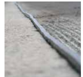
Einfacher Einbau auch bei Walzasphalt mit 5 mm Überstand