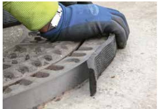
Ideal für unterschiedlichste Materialien und Anwendungen, wie Schachtbauteile oder Betonflanken.

Das leistungsstarke, selbstklebende TOK®-Band SK kann auch ohne Voranstrich eingesetzt werden. So entfällt das mühsame und zeitaufwendige Primern und Ablüften der Fugenflanke! Kein Voranstrich bedeutet zudem kein Gefahrgut, das besondere Anforderungen an Lagerhaltung und Transport erfordert.