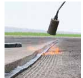
TOK ® -Band A mit Flamme sekundenschnell aktivieren