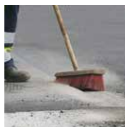
Очистить и осушить грань

Соответствует требованиям норматива ZTV Fug-StB 15