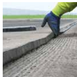
Прижать ленту TOK®-Band A