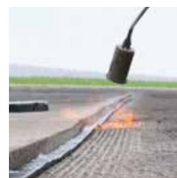
Активировать ленту TOK®-Band A пламенем в течение пары секунд