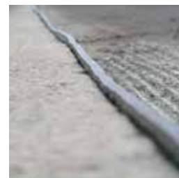
Простая прокладка, в случае укатанного асфальта с выступом 5 мм

„Работа, действительно, идет в два раза быстрее.“