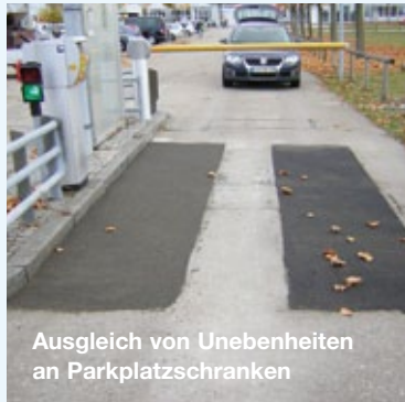
Ausgleich von Unebenheiten an Parkplatzschranken

für viele Anwendungsbereiche auf Asphalt- oder Betonflächen