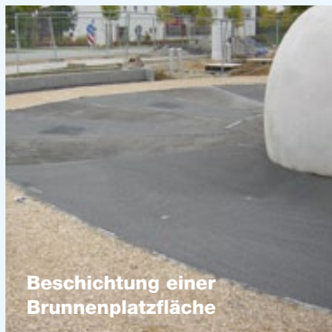
Beschichtung einer Brunnenplatzfläche