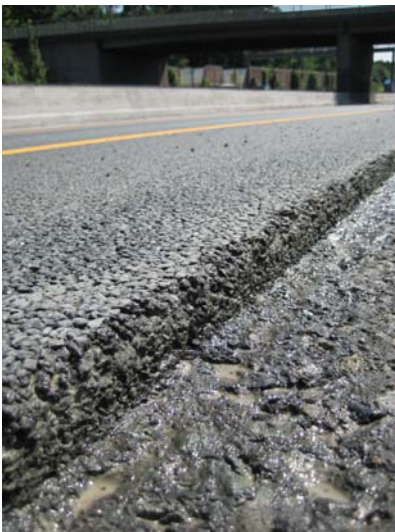
Abbildung 1: Fräskante: Vorzugsweise mit einer Feinfräse herstellen, damit starke Kornausbrüche vermieden werden und eine fachgerechte Flanke für das Fugenband geschaffen wird!