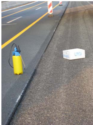
Abbildung 2: Primer: Auftragen des TOK-Primer SK. Optimal z.B. mit einer Gloria-Spritze. Abluftzeit ca. 5-10 Minuten, je nach Witterung.