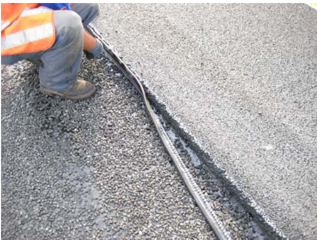
Abbildung 4: TOK-Band DRAIN SK: Verlegen des Bandes. Achtung: Bandüberstand von 5 mm beachten! Das Band fest an die Flanke andrücken!