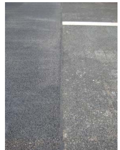
Abbildung 7 (rechts): Nietkopf: Das Ergebnis eines fachgerechten Einbaus ist ein deutlich ausgeprägter an der Oberfläche erkennbarer „Nietkopf“.