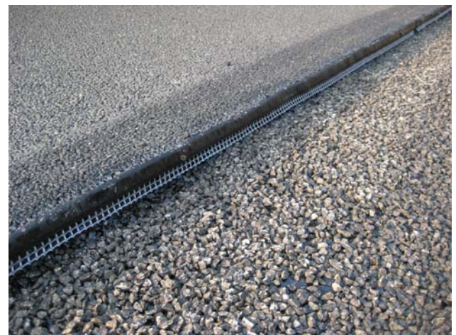
Abbildung 5: TOK-Band DRAIN SK: Fachgerecht verlegtes Fugenband. Oben die bitumenhaltige Masse, unten das wasserdurchlässige Gitterband.