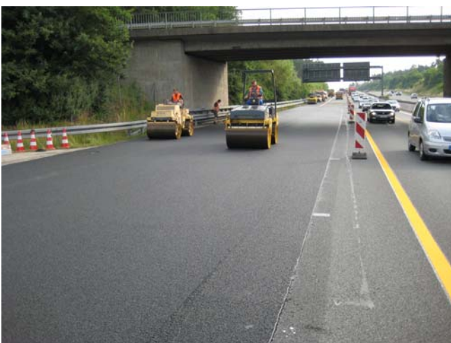
Abbildung 6 (links): Walzgang: Der erste Walzgang sollte auf dem Anschlussbereich „neu an alt“ erfolgen.