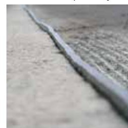
Простая прокладка, в случае укатанного асфальта с выступом 5 мм

„Быстрое нанесение говорит само за себя.“