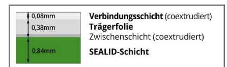
SEALID ® -Tape All-in-1

SEALID ® -Tape ist mit Werksumhüllungen aus PE, PP, FBE, PU und Bitumen kompatibel.