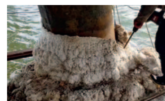
Агрессивные солевые отложения