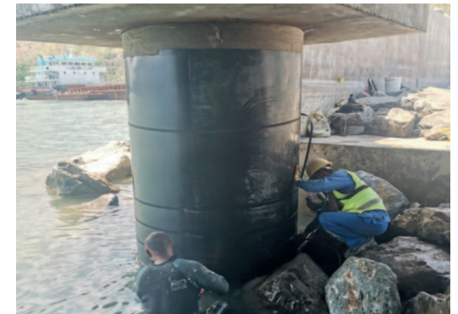
Восточный Тимор, контейнерный порт Тибар MarineProtect®-100 30 свай, DN 1800 (72")