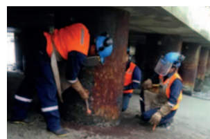
Сильная коррозия на сваях

Морская вода является одной из самых агрессивных природных сред. Постоянно меняющаяся комбинация из воздуха, УФ-излучения и соли разъедает находящиеся в воде сваи и трубы, особенно в зонах переменного воздействия кислорода и смачивания, а также в приливно-отливных зонах. Механические нагрузки, такие как бурное море, обломки, ледоход и обрастание морскими организмами , ускоряют процесс разрушения. Противостоять этим экстремальным условиям в долгосрочной перспективе возможно только с правильной защитой от DENSO: MarineProtect® .