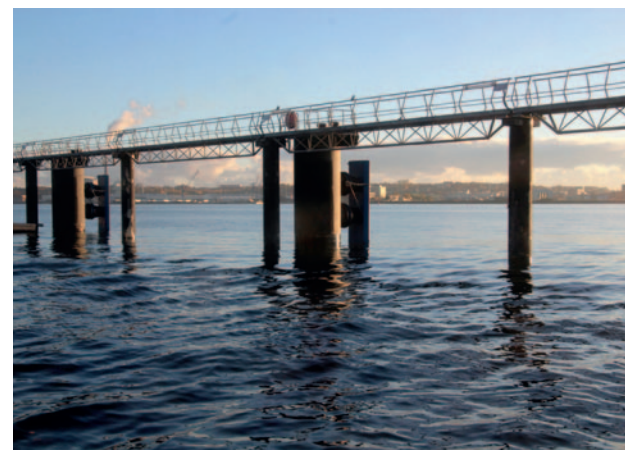
Германия, порт Киль, Балтийское море MarineProtect®-2000 FD Защита свай на крупнейшей пристани круизных лайнеров, DN 2400 (96")