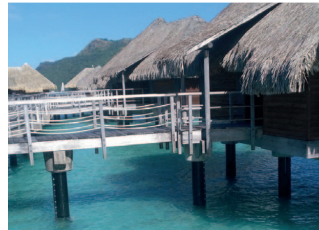
Французская Полинезия MarineProtect®-2000 FD 1.019 свай, DN 300 (12")