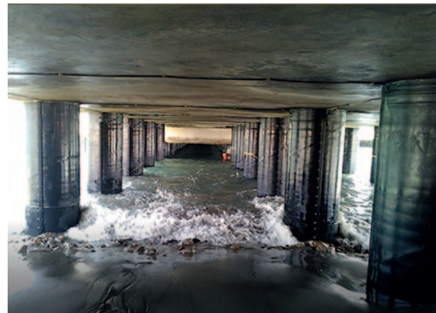
Перу, порт Талара MarineProtect®-2000 FD 206 свай, DN 1000 (40")

От Бора-Бора до Туркменистана: на протяжении многих лет MarineProtect® успешно используется в Атлантическом океане, а также в Карибском, Каспийском и Черном морях.