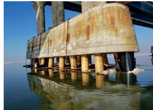
Иран, мост на озере Умрия MarineProtect®-100 372 свай, DN 800 (32")